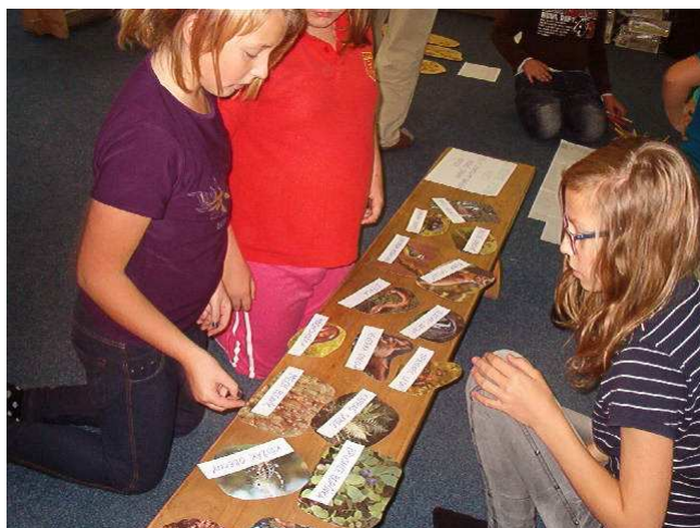
Výstava Les – návštěva 5. třídy