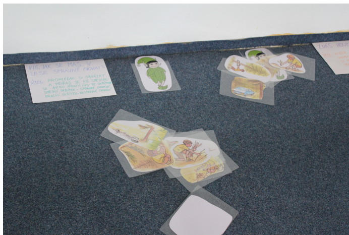
Výstava Les – stanoviště správného chování