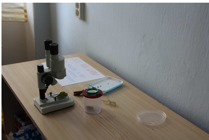
Výstava Les – pozorování binokulární lupou