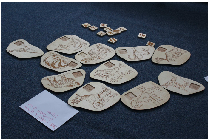
Výstava Les – stanoviště poznávání stop živočichů v lese

Výstava k tématu Ochrana lesa byla interaktivní. Děti si samy zkoušely různé úkoly, hrály si s didaktickými pomůckami zaměřenými na poznávání lesa. Celkem jsme pro děti připravili 6 stanovišť. Úkoly na těchto stanovištích byly například: poznávání stromů podle listů a plodů, poznávání jedlých a nejedlých hub, poznávání stop, frotáž listů, pozorování přírodnin binokulární lupou, třídění věcí vyrobených ze dřeva, poznávání lesních živočichů, atd.