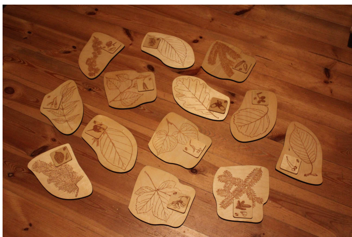
Dřevěná skládanka listy stromů a jejich plody