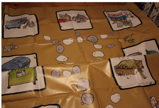
Venkovní plachta – třídění odpadů