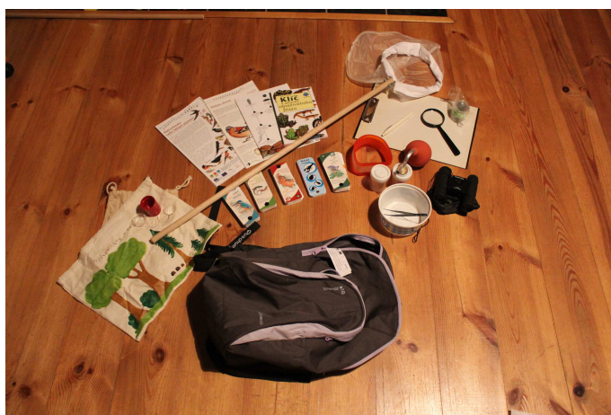
Vnitřní obsah batůžků