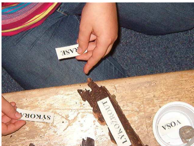
Výstava Les – návštěva 5. třídy